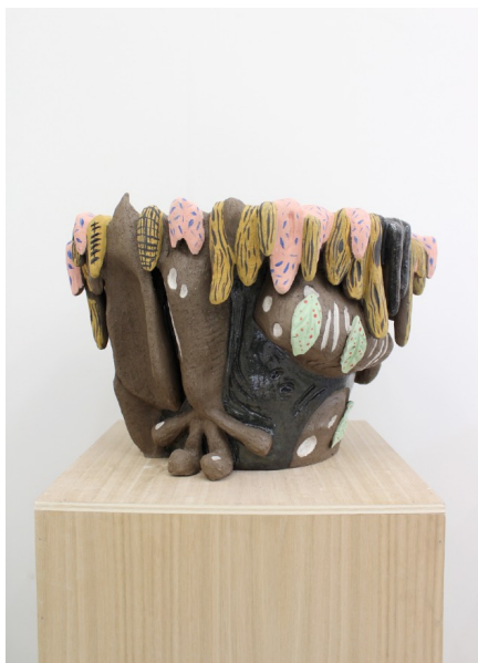
Les travailleurs de la mer (pattes), 2019 Glazed earthenware - Signed & dated 50 x 40 x 25 cm 19.6 x 15.7 x 9.8 in. Unique