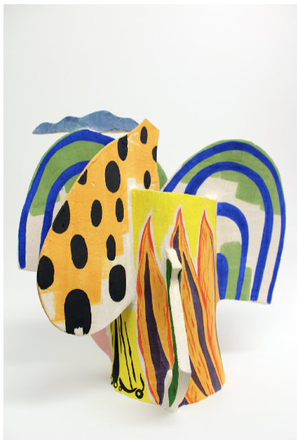
Barbodoigts (pyrénées), 2018 Glazed earthenware - Signed & dated 35 x 30 x 20 cm 13.7 x 11.8 x 7.8 in. Unique