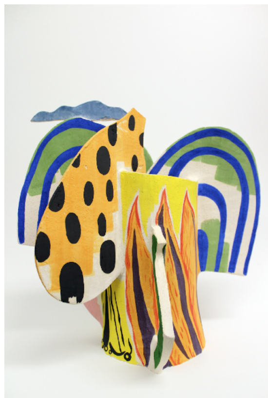
Barbodoigts (pyrénées), 2018