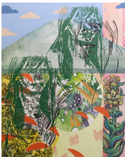
Marisa, 2019 Mixed media on paper on canvas - Signed & dated 60 x 80 cm 23.6 x 31.4 in. Unique